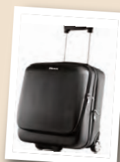
Valise trolley rigide