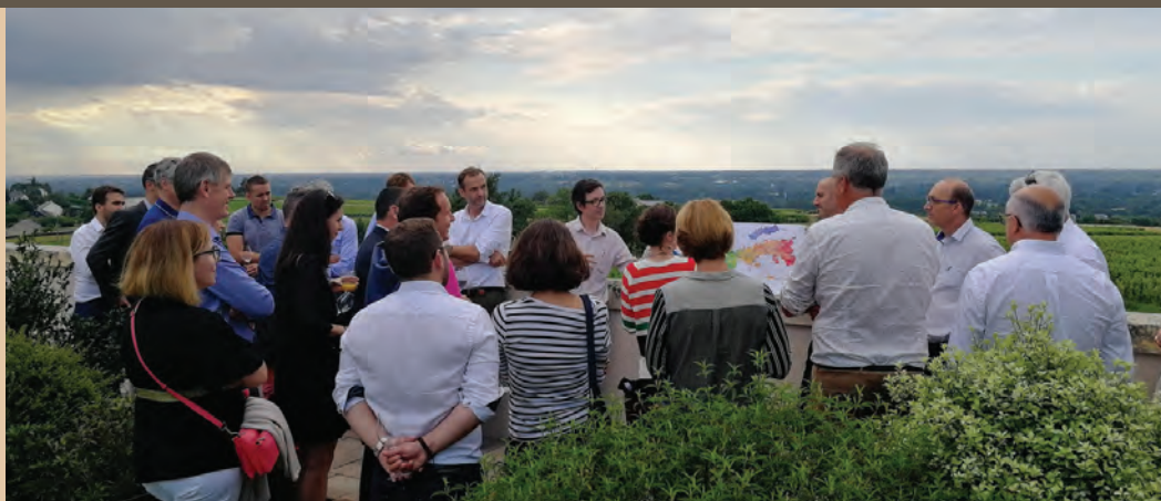
Une visite dans un chais après la réunion