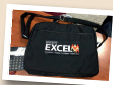
Sacoche ordi 2016